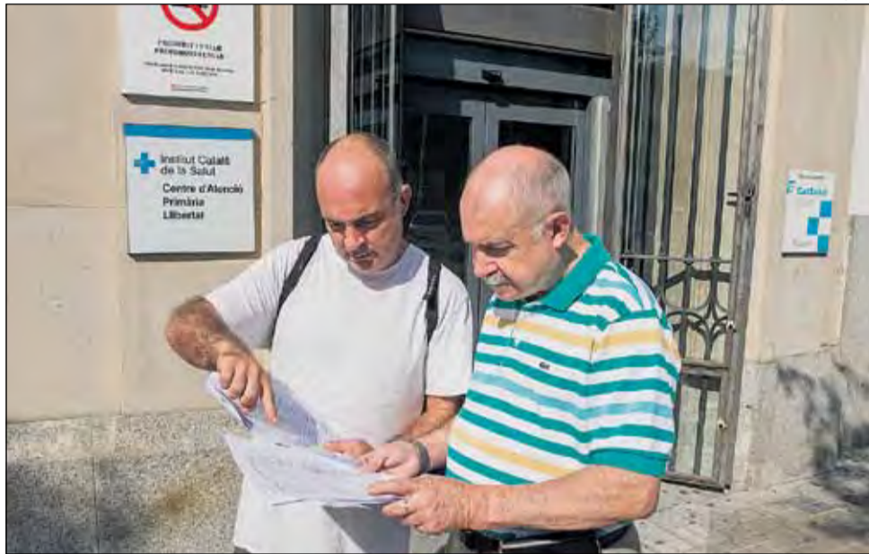
Representants del sindicat USITAC, amb les signatures recollides.

Més enllà de l'episodi excepcional de calor que s'està vivint aquests dies i que s'està patint en diferents àmbits, des del sindicat USITAC lamenten la manca de voluntat per posar fi a una situació que asseguren que no és la