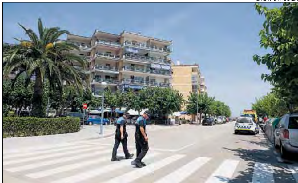
Els agents, una hora després de l'accident, al pas de vianants on es va produir l'atropellament.

Tot plegat succeïa minuts després de dos quarts d'una del migdia. El Servei d'Emergències Mèdiques no va poder reanimar