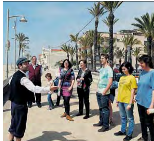
Dos personatges porten els visitants per l'equipament.