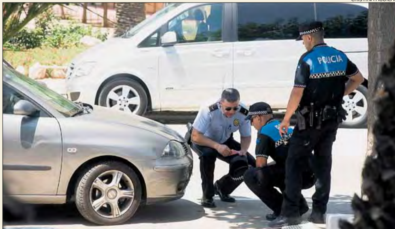
Agents, al costat del cotxe implicat en l'accident, ahir al migdia a Vila-seca.

REUS La situació afecta al vestíbul del centre, on hi ha el taulell d'admissions, i una sala d'espera, i s'estan recollint signatures. P7