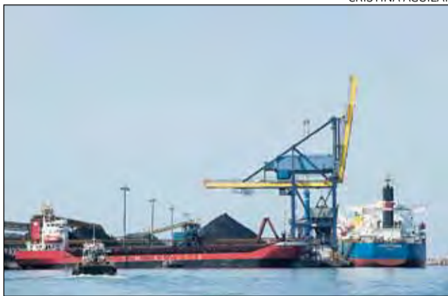
La planta funcionarà tots els dies de l'any.

La nova infraestructura, promoguda per Hera Tratesa, s'ubicarà en una parcel·la de 10.038 metres quadrats al costat mateix de les institucions portuàries. La planta donarà una solució d'emmagatzematge i tractament de residus com hidrocarburs, substàncies nocives líquides a granel, aigües fecals i escombraries sòlides. També tractarà els residus industrials que es generin a l'àrea d'influència de la zona portuària. El projecte planteja unes instal·lacions de tractament total, des de la descàrrega dels residus,