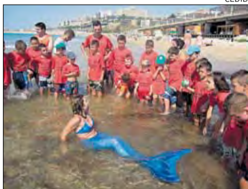
Una sirena va donar el missatge de conscienciació.

La jornada de sensibilització ambiental 'Dia de neteja de la platja' es va adreçar a infants de Bonavista