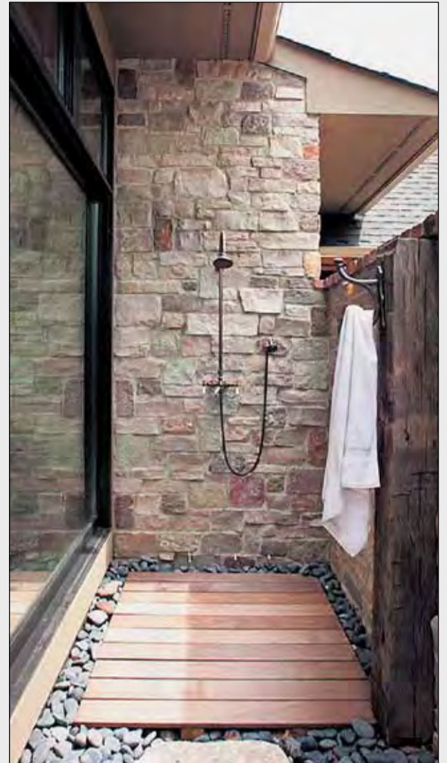
A banda de als jardins, també s'instal·len en patis i terrasses.

Segui quina sigui l'opció triada, haurem d'acondicionar la zona on la col·locarem per tal d'evitar entollaments d'aigua, per això, en les dutxes amb instal·lació, caldrà ubicar un sumidero i preparar la zona per a una filtració d'aigua correcta.