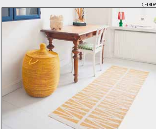
Les catifes de plàstic presenten dissenys cridaners.

Tot i utilitzar un material atípic, les catifes de plàstic es teixeixen de forma tradicional