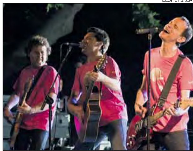
Imatge d'arxiu d'un dels concerts de la banda tarragonina.

A partir del 23 de juliol es posaran a la venda les entrades per als espectacles Pels Pèls , Rússia multicolor , Penèlope , Ferriure és un art , Els Pets 3.0 , El concert de Cap d'Any, Raspall i Torna Robin Hood . La venda serà en exclusiva a través del web www.teatrefortuny.cat . La