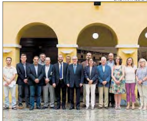
Representants de les dotze entitats que reben l'ajuda.