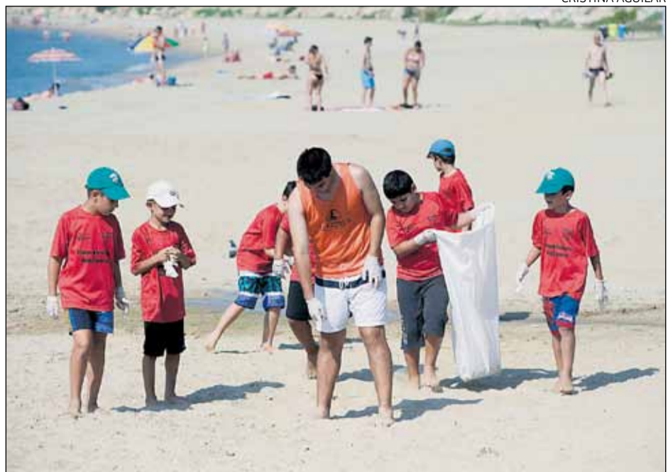
Van participar-hi nens que estan fent el campus d'estiu de futbol del Racing Bonavista.

El Dia de neteja de la platja va comptar amb la col·laboració de l'Ajuntament de Tarragona, Europe Direct Tarragona, Sirenas Mediterranean Academy, la Coordinadora d'Entitats de Tarragona i el Tarraco Club Muntanyenc.