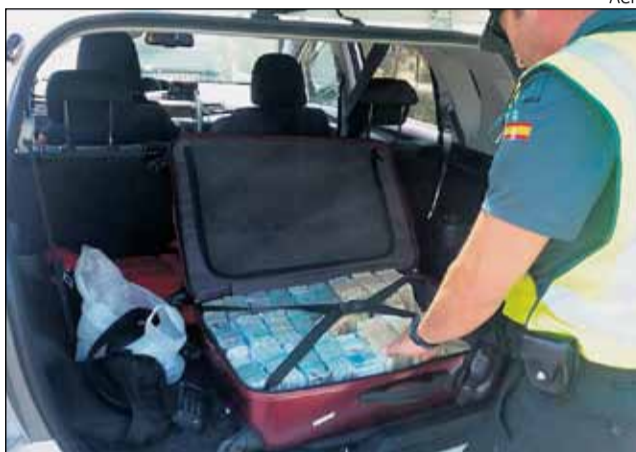
Un agent de la Guàrdia Civil inspecciona la maleta al taxi.

En registrar el maleta, els agents van trobar una maleta amb nombrosos paquets de bitllets de curs legal de 5, 10, 20 i 50 euros, que sumaven un total de 700.000 euros. El passatger del taxi, un ciutadà libanès amb passaport alemany, no disposava de cap tipus d'autorització per traslladar aquests diners, tal com regula la llei de prevenció de blanqueig de capitals i finançament del terrorisme.